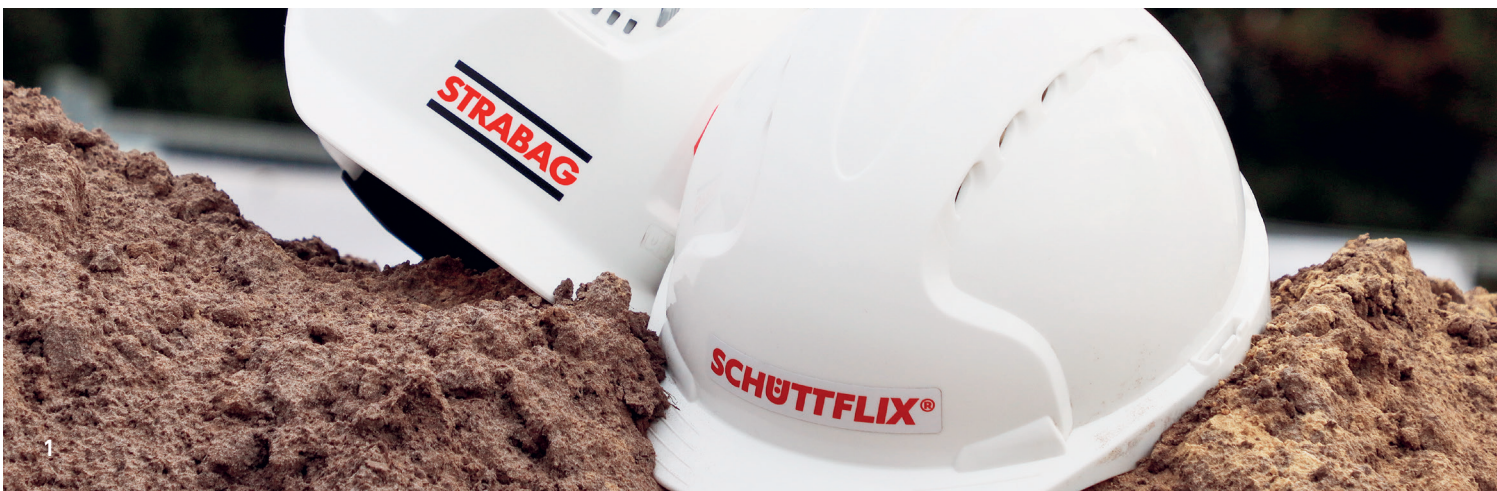
1 Gemeinsam die Baubranche digitalisieren – das ist das Ziel von STRABAG und Schüttflix.